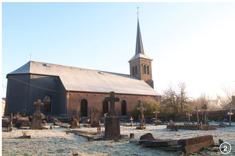
L'église Saint-Jean-Baptiste à Villeroux (1874) et son Vieux cimetière