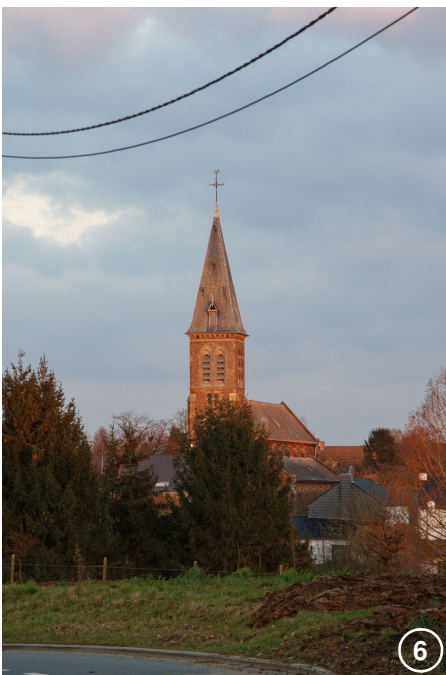
L'église Notre-Dame à Cortil (1904)

L'église Notre-Dame surplombe la place du 7 e Tirailleur Marocain, qui nous rappelle les tristes événements de la dernière guerre. Sur le coin, nous passons devant l'ancien presbytère, magnifiquement restauré. Au carrefour, prenez à droite et