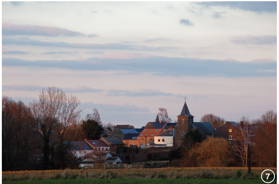
L'église Saint-Pierre à Noirmont (dernier quart du XVIII e siècle)

la première à gauche, rue du Bief. Ce petit détour vous permet de découvrir l'ancien moulin (bâtiments des XVIII e et XIX e s.) dit « de Cortil », quoique bel et bien situé à Noirmont.