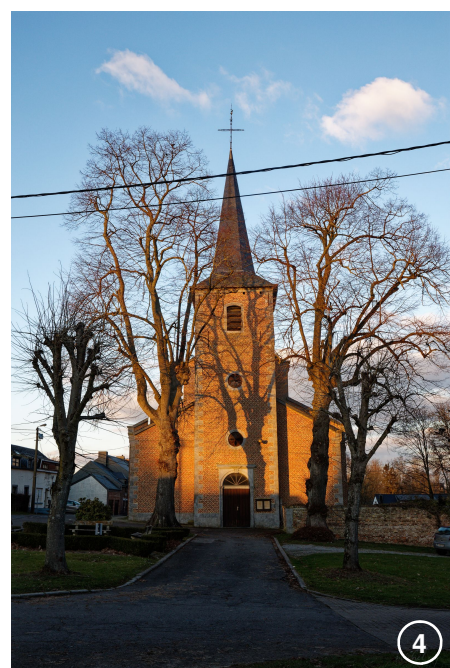
L'église Sainte-Gertrude à Gentinnes (1787, clocher et 1863, nef)