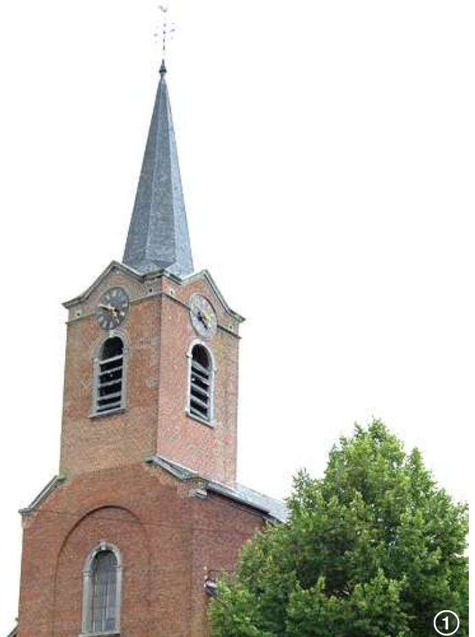
Le clocher de l'église Saint-Martin à Blanmont (1861-1862)

C'est à un parcours villageois à vélo que nous vous convions. Revêtements : béton, quelques passages pavés, sentiers de terre. Aucune difficulté particulière, dénivelés faibles. Accessible aux familles... si tout le monde est à vélo. Belle balade !