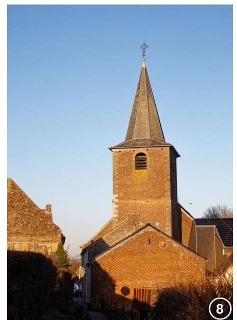
L'église Notre-Dame-Alerne à Chastre (1780)

Continuez tout droit, passez un croisement en ignorant le chemin sur votre gauche, puis dirigez-vous à droite, rue de Saint-Géry. Celle-ci aboutit à la rue du Centre, que vous empruntez à droite. Après quelques mètres, bifurquez dans la rue du Piroy, du même nom qu'un ancien moulin, actuellement transformé en habitations. Suivez la rue Par delà l'Eau qui oblique à gauche et à son terme, à gauche puis à droite, vers le huitième clocher , celui de