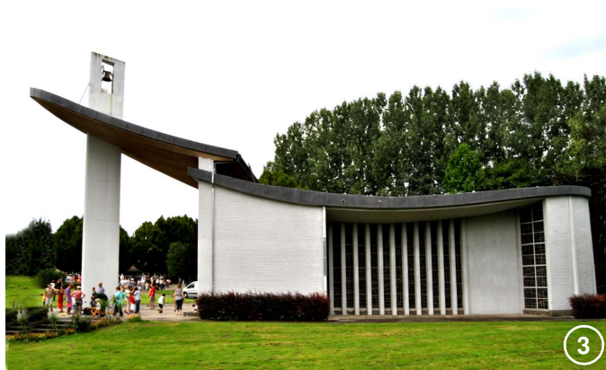
Le Mémorial Kongolo à Gentinnes (1967)