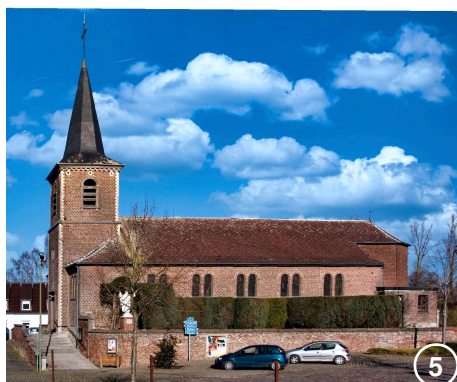
L'église Sainte-Géry à Saint-Géry (1836)

Prenez tout de suite à droite, la rue du Pont d'Arcole, un chemin pittoresque s'ouvre à vous et aboutit à un petit pont au-dessus de la Houssière. Tournez à gauche et prenez la rue de Mellery sur votre droite. Face au numéro 28, empruntez le sentier de la « promenade de la Fontaine Saint-Géry », réservé aux piétons et cyclistes. Attention, ce chemin peut être très boueux et peu praticable, s'il a beaucoup plu. Dans ce cas, ignorez-le et continuez la rue jusqu'à la rue de l'État, que vous